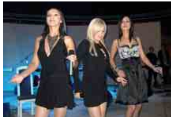
Wenn Popstars heiraten, versammelt sich in der Regel das gesamte usbekische Show-Business. Im Bild der Auftritt der Band Setanho im Hotel Uzbekistan anlässlich der Hochzeit von Sevara Nazarkhan, die auch in der Weltmusikszene im Westen bekannt ist.