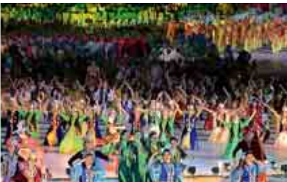
Tanzen gilt bei Hochzeiten (Bild oben) als Ehrerbietung gegenüber dem Brautpaar. Männer und Frauen tanzen in der Regel getrennt; dabei verteilen die Verwandten des Brautpaares Geld an die Tanzenden, die es dann an die Musiker weitergeben – die Haupteinnahmequelle für die meisten von ihnen. Bild unten: Die offiziellen Feiern zum Unabhängigkeitstag im September sind jedes Jahr ein lange vorbereitetes, perfekt inszeniertes und engmaschig kontrolliertes Spektakel, bei dem sich Tausende von Akteuren zu einem Playback über die Bühne bewegen. Die Auftritte der Stars der Popmusik bilden den Höhepunkt der Veranstaltung.

Ende November sitze ich in einem Unterrichtsraum im Konservatorium. Die Leiterin der Populärmusik-Gesangsabteilung probt einen neuen Song mit einer Studentin. Die Heizung funktioniert nicht, es ist bitterkalt, man kann den eigenen Atem sehen, und wir tragen Mäntel und Schals. Von meinem Platz aus fällt mein Blick durch die riesige Glasfront des Raums über das Stadion des Taschkenter Fußballclubs „Paxtakor“ – „Der Baumwollpflücker“ – und die Sowjetbauten des Zentrums auf die schneebedeckten Berge hinter der Stadt, und das alles unter einem strahlend blauen Himmel im Sonnenschein. Die Studentin singt eine pathetische Hymne auf Usbekistan und seine Hauptstadt, die im Refrain „Yakkadir Toshkent“ – „Taschkent ist einzigartig“ – kulminiert. Während mir die Kälte den Rücken entlangkriecht, die Zähne klappern und ich meine Füße nicht mehr spüre, denke ich, wie Recht sie doch hat und wie sehr ich diese Stadt inzwischen liebe.